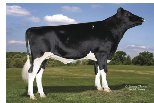
Melarry Ssi Rengd Forbes-ET